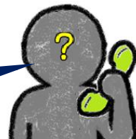
「ハウスメーカー」の ワダを名乗る男